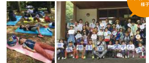
ファミリーデーの様子